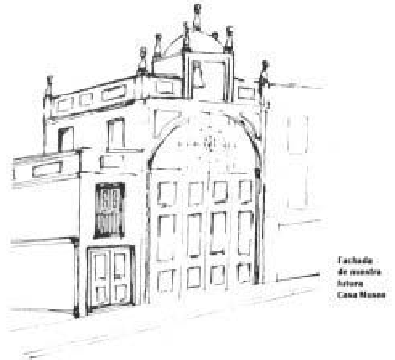
Fachada de nuestra Antigua Casa Museo

D.: Una vez relleno el boletín de inscripción, hacerlo llegar a la Hermandad, bien por correos a C/ Agua, 4 entregándolo personalmente en la Hermandad los martes a partir de las 21 h., o los sábados por la mañana tarde, o llamando por teléfono al 256031 los días anteriormente citados.