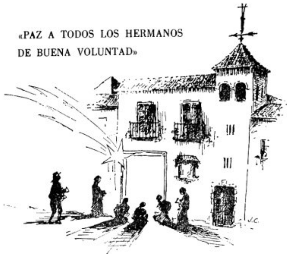
(Dibujo de Juan Casielles del Nido Dic - 79)

«PAZ A TODOS LOS HERMANOS DE BUENA VOLUNTAD»