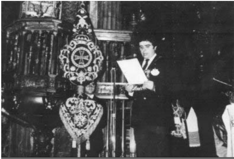
Invocación al Apóstol Santiago realizada por el Hermano Mayor el 10-10-82 en la Peregrinación realizada por la Hermandad.