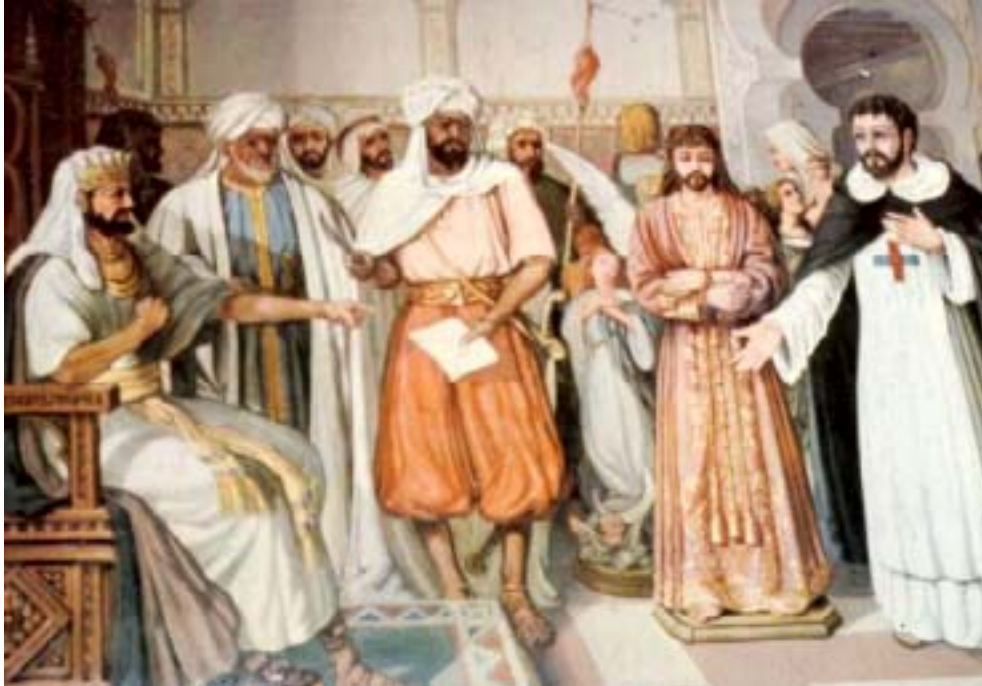
Rescate de la Imagen de Ntro. Padre Jesús Nazareno por los Trinitarios

Descubriendo el año 1681 se vio perturbada la paz reinante en el puerto de Mámora, en la costa atlántica de Mauritania perteneciente a la Monarquía Española.