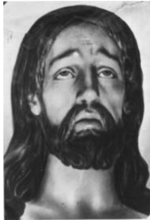
Imagen de Ntro. P. Jesús del Rescate

ESPERAMOS LOS DONATIVOS DE TODOS LOS HERMANOS, PARA SUFRAGAR LOS GASTOS DE RESTAURACIÓN DE LA IMAGEN DE MARIA SANTÍSIMA DE GRACIA.