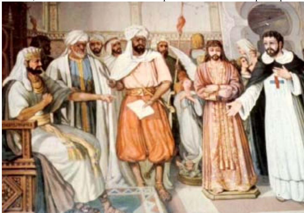
Rescate de la Imagen de Ntro. Padre Jesús Nazareno por los Trinitarios

Descubriendo el año 1681 se vio perturbada la paz reinante en el puerto de Mámora, en la costa atlántica de Mauritania perteneciente a la Monarquía Española.